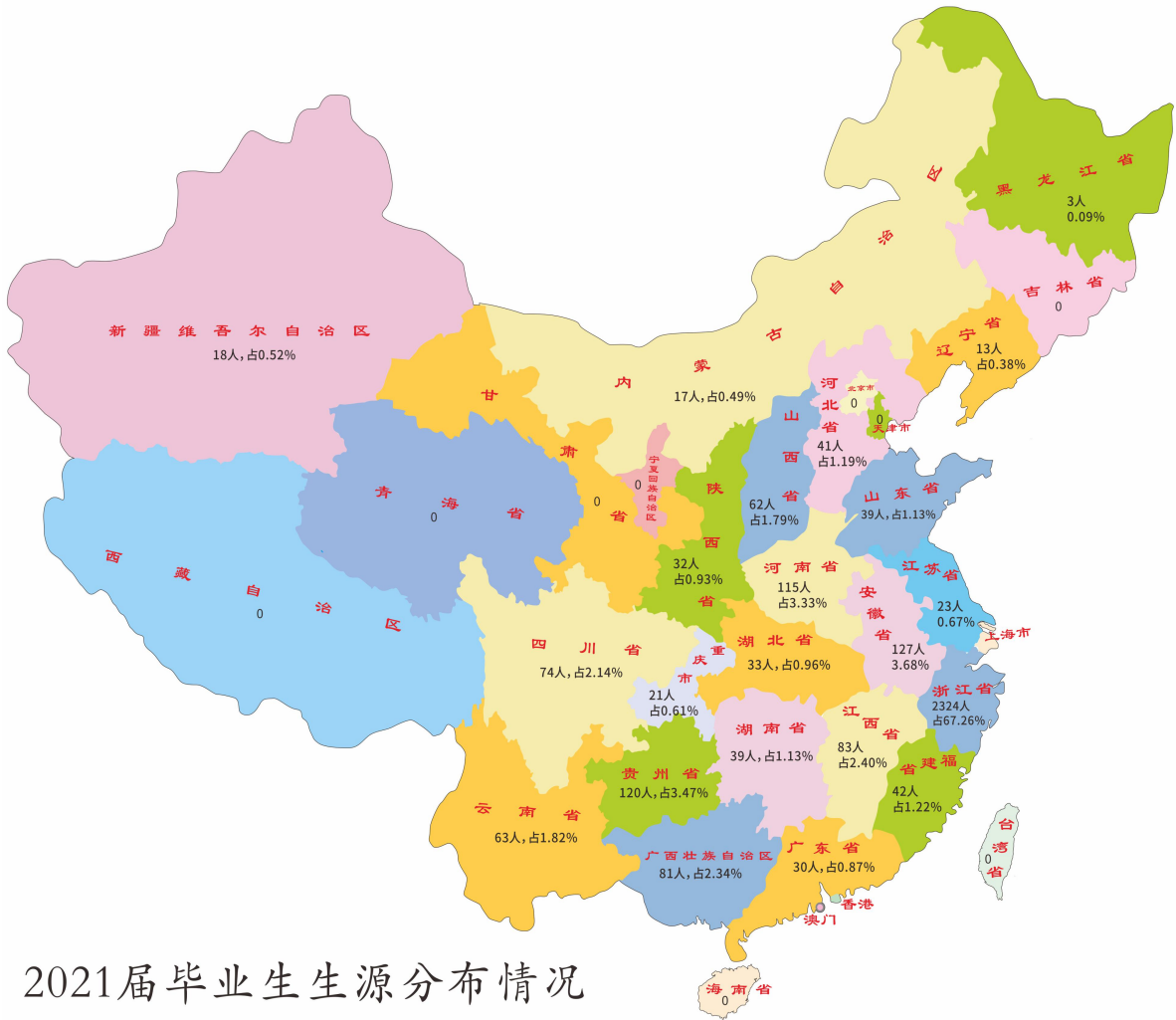
2021届毕业生生源分布情况