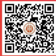
南京审计大学就业在线