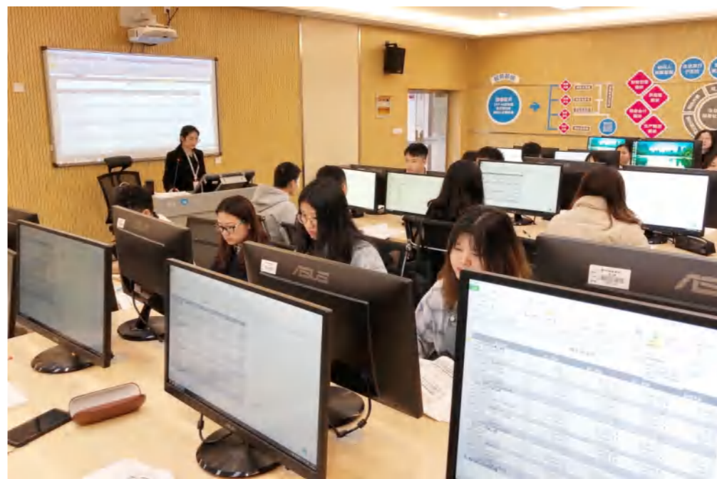
我校会计学院学生在财税信息化实验室进行教学活动