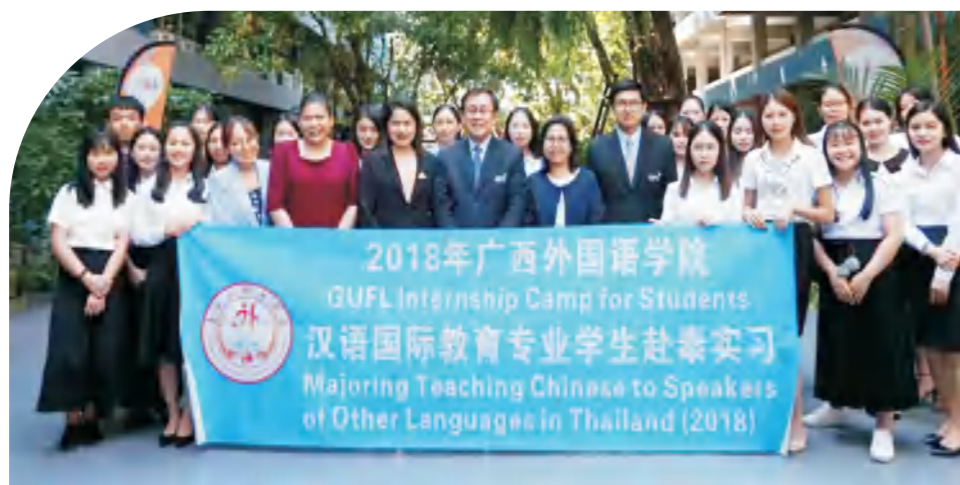
我校汉语国际教育专业学生赴泰国实习