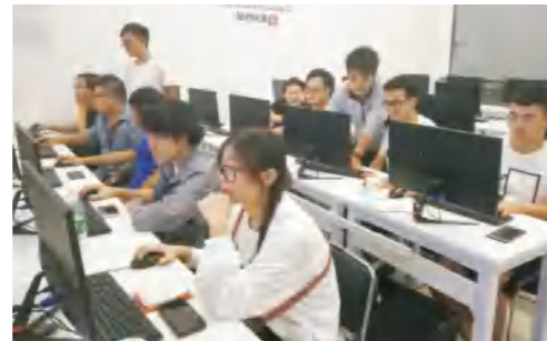
学校网络工程专业学生在中软国际开展实习实训

● 就业方向： 毕业后可在政府机关、企事业单位、银行、证券、网络公司、电子商务等行业，从事网站规划、数据库管理、网络系统安装与维护、网络工程监理、网络设备销售与技术支持、互联网应用平台开发等工作；亦可考取公务员或国内外攻读硕士或自主创业。