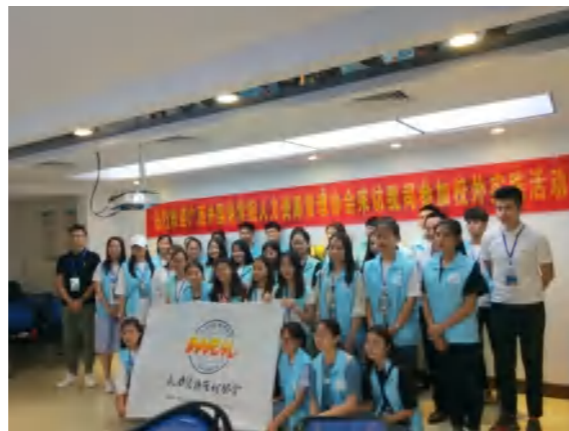
人力资源管理学生会到校企合作单位开展活动