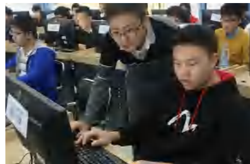
东软公司校外专家指导学生WEB前端实训