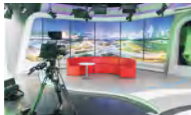
学校全媒体 交互式跨专业 与语言应用中心