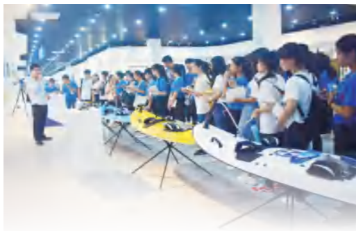
▲学校市场营销专业学生到南宁市第二象限环保科技有限公司参观学习“互联网+”“废纸回收平台”