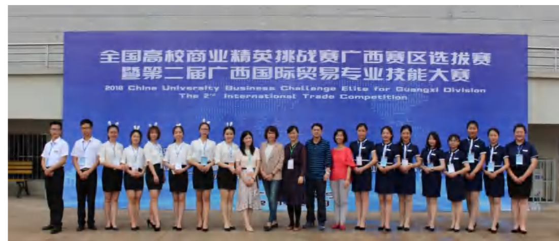
全国高校商业精英挑战赛广西赛区选拔赛暨第二届广西国际贸易专业技能大赛

● 就业方向: 毕业后可在商业银行、证券公司、保险公司、基金公司、投资公司、互联网金融公司、理财公司、期货公司、资产管理公司、信托公司、信用社等金融行业企业从事金融风险、管理、投资与资金管理、公司理财、网络金融等方面的工作;亦可考取国家公务员或国内外攻读硕士或自主创业。