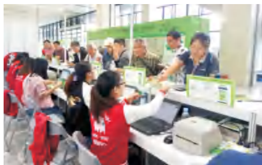
学校市场营销专业学生参加第七届茶博会志愿者服务实践活动

● 就业方向： 可从事创新创业型公司CEO、职业经理人、营销总监、策划创意总监等，尤其擅长面向东盟国家和地区的市场调研、营销策划、多媒体传播、市场开发、品牌建设、商务拓展等方面工作；亦可考取国家公务员或国内外攻读硕士或自主创业。