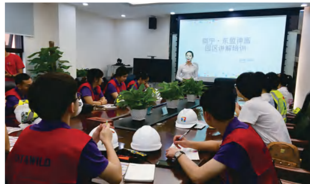
我校小语种专业学生到南宁方特东盟神画乐园实习实践

● 就业方向： 毕业后可在外贸、旅游、酒店等各类企事业单位、政府机关机构及有关部门从事各类涉外工作；亦可考取国家公务员或国内外继续深造或自主创业。