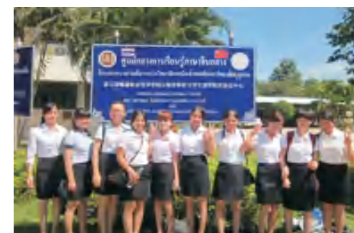
学校文学院学生赴泰国任教

● 就业方向： 毕业后可在各类企事业单位，媒体、新媒体机构、平面媒体、广播电视媒体、网络媒体、公关公司以及其他新闻媒体和文化传播机构从事新闻采编、宣传策划、舆情监控、新媒体策划与运营、文案写作、广告创意等工作；在各类传媒、党政机关、企事业单位以及其他公共传播机构从事新闻采访、写作、编辑、拍摄、主持、策划和传媒经营管理等工作；亦可考取公务员或国内外攻读硕士或自主创业。