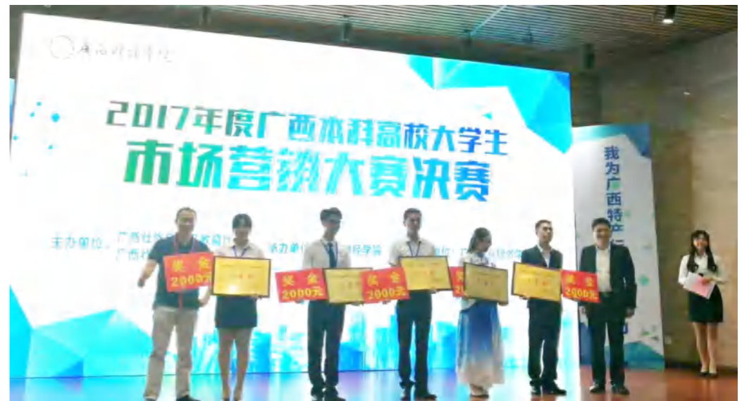
学生在广西本科高校大学生市场营销大赛中荣获2个三等奖