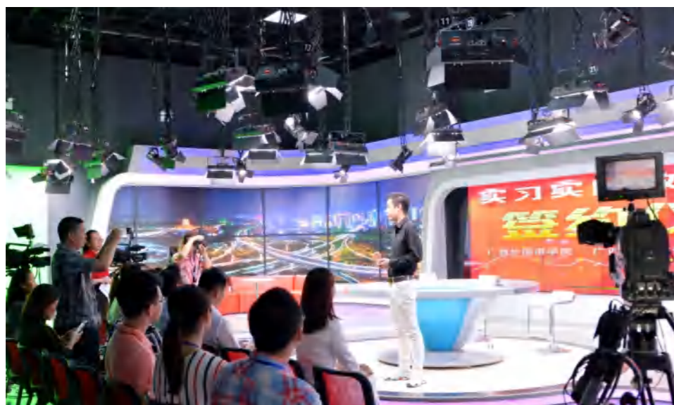
我校实习实训教育基地——广西悦星文化产业投资有限公司负责人为学生开展就业指导讲座