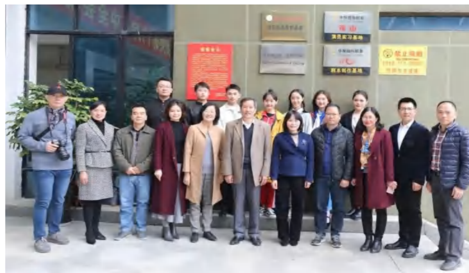
广西外国语学院与崇左广播电视台实习实训基地签约挂牌仪式在崇左广播电视台举行