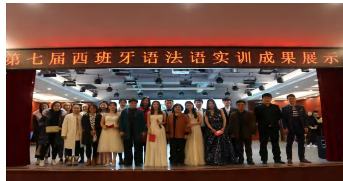
第七届西班牙语、法语实训实践成果展示

● 就业方向： 毕业生适合在外贸、旅游、酒店和涉外企业从事基础西班牙语翻译、导游、外联、教育培训咨询等工作;亦可考取国家公务员或国内外继续深造或自主创业。