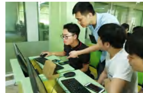
华清远见公司专家指导学生课程实训