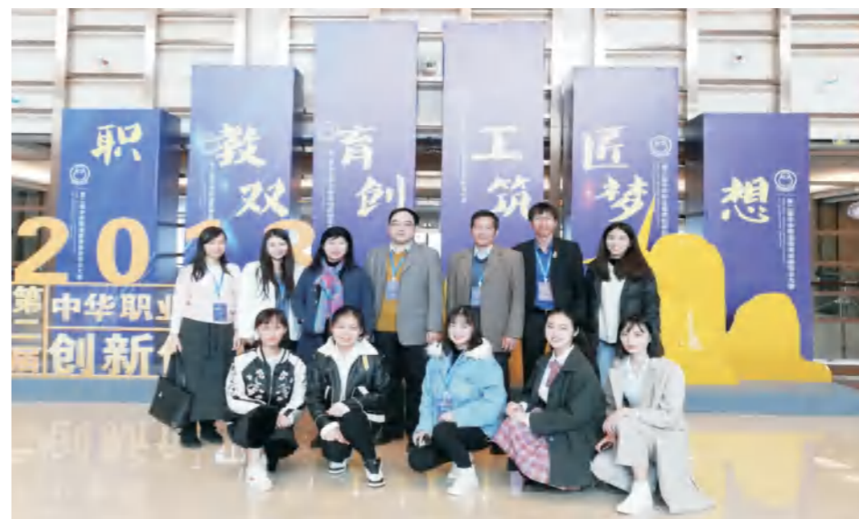
学校艺术设计学专业学生在第二届中华职业教育创新创业大赛全国总决赛中获得铜奖

● 就业方向： 毕业后可在国内外的艺术设计相关领域、各类企事业单位、房地产企业、文化传播机构、广告设计公司、创意策划公司、装饰设计公司、影视传媒机构，也可在艺术教育、研究、城建部门和文化出版等单位从事艺术、设计教学、研究、编辑、宣传制作等方面工作。亦可考取国家公务员或国内外攻读硕士或自主创业。