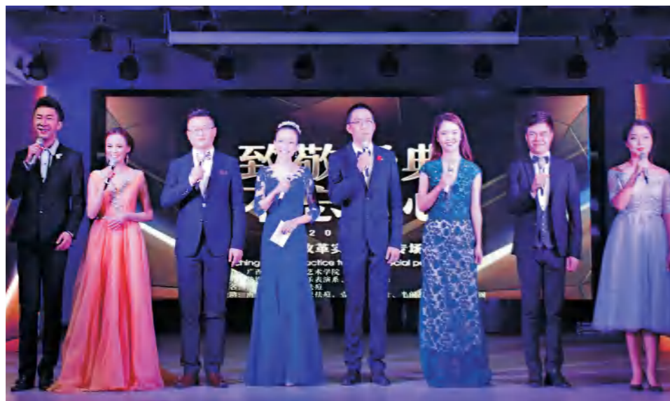
学校艺术学院年度“学训展行展演周”闪亮开幕

● 就业方向： 毕业后可在各级广播电视台、传媒机构、新媒体平台、文化产业、企事业单位等从事播音与主持、节目策划与制作、文案创作、沟通营销、对外联络与接待、活动策划与组织、部门协调与管理等工作；亦可考取国家公务员或国内外攻读硕士或自主创业。