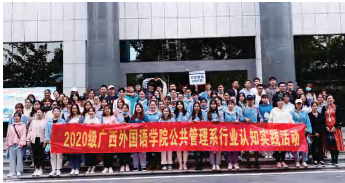
2020级公管系学生开展行业认知实践活动

● 就业方向： 毕业后可在文化、体育、卫生、环保、社会保障等公共事业单位、行政管理部门、非政府组织等公共部门以及企事业单位从事业务管理、涉外事务管理和综合管理工作;亦可考取国家公务员或国内外攻读硕士或自主创业。