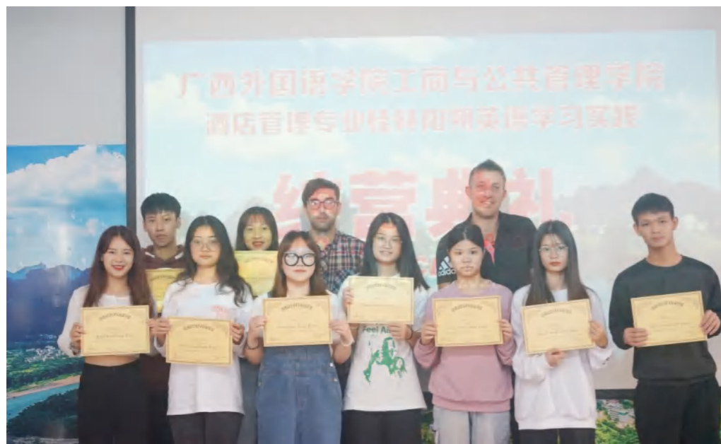
桂林阳朔英语学习实践周

● 就业方向： 毕业后可在各类涉外酒店从事管理或服务方面的工作；可在各类型酒店集团或酒店，为酒店员工提供专业培训、市场营销工作；亦可考取国家公务员或国内外升本继续学习或自主创业。