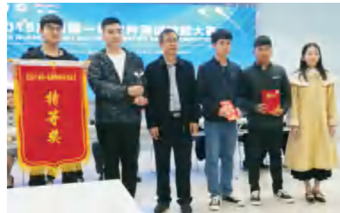
学校信息工程学院软件工程专业学生在第一届广西软件测试技能大赛中获得特等奖

● 就业方向： 毕业后可在IT行业、企事业单位从事计算机应用软件系统的设计开发、工程管理、运行维护、技术服务和软件测试等方面的工作；亦可考取公务员或国内外攻读硕士或自主创业。