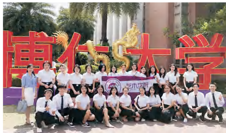
学校中泰双语播音与主持艺术专业方向学生赴泰国博仁大学留学