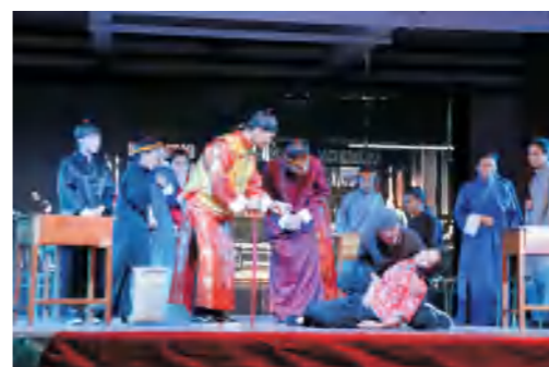
学校“金蔷薇文化艺术节”——汉语言文学专业中国现代文学演示会《茶馆》剧照

● 就业方向： 毕业后可在企事业单位从事行政工作；也可在传媒与文化传播类单位，如电台、电视台、报社、杂志社、出版社、网络平台、文化创意与传播公司等从事创作、记者、编辑、策划工作；还可以在中小学从事语文教学工作；亦可考取公务员或国内外攻读硕士或自主创业。