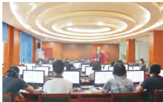
学校法语专业学生在可视化同声传译实验室上课

● 就业方向： 毕业后可在经济、贸易、文化、涉外企业等领域，尤其能在与法语国家有交流或在法语地区开发业务的企业从事翻译、商务、文化交流等工作或自主创业。