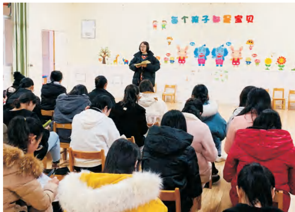
学校学前教育专业学生到幼儿园开展实践教学活动

● 就业方向： 毕业后可在幼儿园和涉外幼儿教育机构从事学前教育教学、管理工作，也可以在文化、教育等部门从事幼儿教育产业的策划、开发、组织和运营工作亦可考取国家公务员或国内外攻读硕士或自主创业。