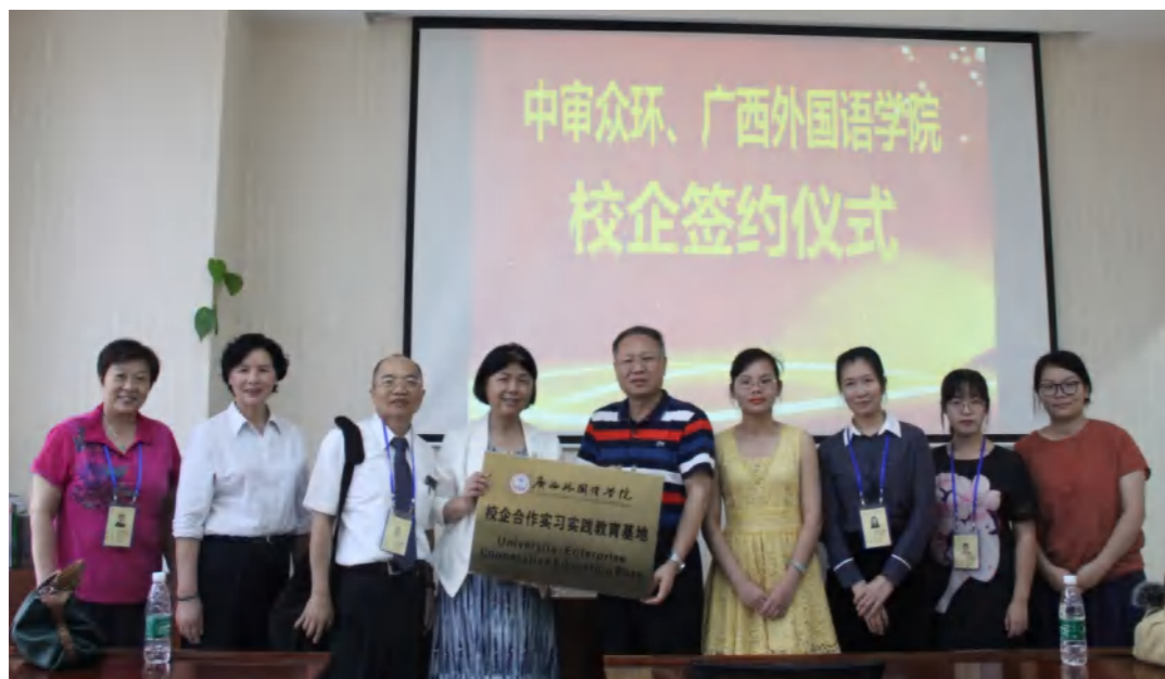
广西外国语学院与中审众环会计师事务所共建校企合作实习实践教育基地

● 就业方向： 在各类企事业单位从事财务管理工作，具体包括企业成本核算、统计、财务出纳、财务会计、总账会计、企业理财，也可以到会计师事务所、税务师事务所从事财务管理、税务、审计等实际工作；亦可考取公务员或国内外继续深造或自主创业。