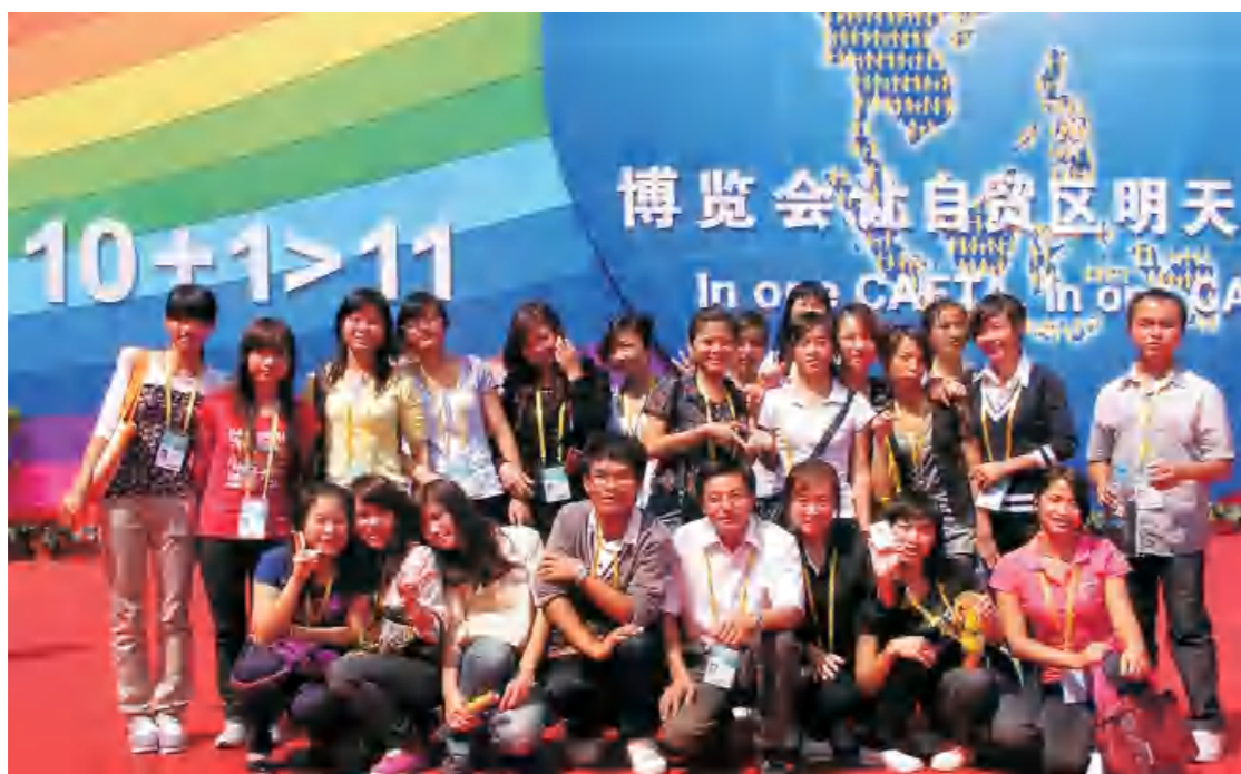
学校工商与公共管理学院学生积极为中国-东盟博览会服务

● 就业方向: 毕业后可在各商业银行、外汇交易所、金融公司、证券公司、保险公司、基金公司、期货公司等金融机构从事商业银行柜员、理财投资顾问、证券代理、保险代理、期货代理、外贸企业会计人员等各类国际金融相关业务工作;亦可考取国家公务员或国内外升本继续学习或自主创业。