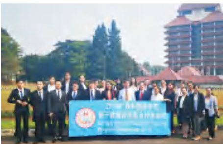
学校组织教师赴印度尼西亚高校访学交流

全力打造面向东盟的国际化办学特色。与泰国、越南、柬埔寨、缅甸、老挝、马来西亚、印度尼西亚等国家70多所大学签订交流合作协议，招收1500多名国际生，派送近5000名学生赴合作高校接受学分互认的课程学习和社会实践，学校的国际影响力和认可度逐步提升。据搜狐网“2017中国最好大学排名——学生国际化排名(留学生比例)”，我校位居广西高校前列、广西民办高校首位；京领新国际创业时代网“2018中国民办大学国际化竞争力排行榜300强”榜单中，我校排名第五，其中“出国留学生占学生总人数比例”“海外留学生占学校总人数比例”两个单项排全国民办高校第二名；在“2019年中国民办大学国际化竞争力300强”排行榜中位列全国第四、广西第一；在“2020年中国民办大学国际化竞争力300强”排行榜中位列全国第一。