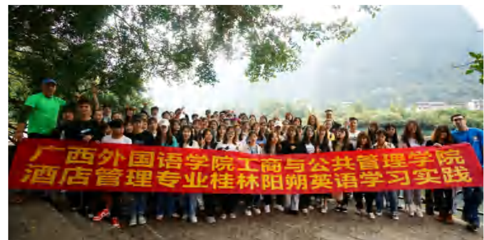
桂林阳朔英语学习实践周

● 就业方向： 毕业后可在高星级酒店、高级住宿业机构、高级餐饮业机构、旅游观光服务机构等行业企业从事酒店管理及经营等方面工作;亦可考取国家公务员或国内外攻读硕士或自主创业。