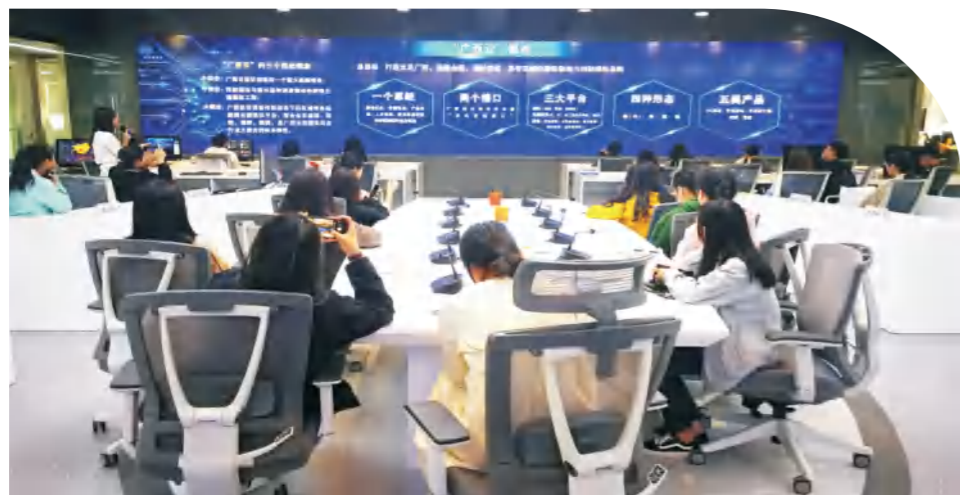
学校新闻学专业学生赴广西新闻网开展专业认知实践活动

● 就业方向： 毕业后能够从事对外汉语教学和中国文化传播工作，可在国内各类学校、新闻出版、文化管理或企事业单位从事语文教学、语言文化研究、中外文化交流或涉外事务管理等工作；亦可考取公务员或国内外攻读硕士或自主创业。