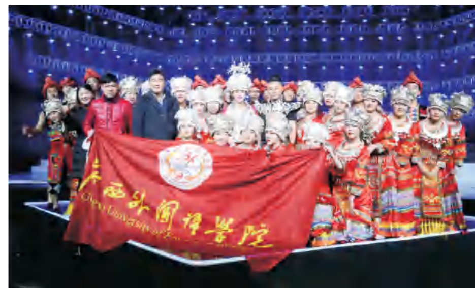
学校音乐表演专业学生受邀参加央视《合唱春晚》录制

● 就业方向： 毕业后可在文艺团体、社会文化培训机构、学校等从事音乐舞蹈表演、教学、研究、管理等方面工作；亦可在对外文化交流机构、孔子学院(东南亚)等部门从事文化交流、艺术教育、文化普及等相关工作；亦可考取国家公务员或国内外攻读硕士或自主创业。