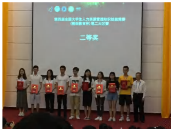
人力资源管理知识技能竞赛区域赛获二等奖.2019.左三学生代表

● 就业方向： 毕业后可在企事业单位、政府机关、社会机构团体从事人力资源管理方面工作；亦可考取国家公务员或国内外攻读硕士或自主创业。