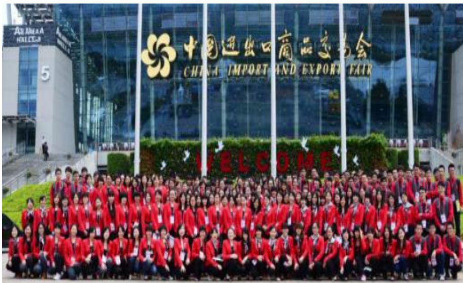
商英学院学生参加中国进出口商品交易会（广交会）实习

课程设置： （1）英语课程：综合商务英语、法律英语、商务英语写作、商务英语听说、英语口语译/笔译、商务口译/笔译、高级英语阅读与写作、英语国家社会与文化、英美文学、跨文化商务交际等。（2）方向课程：民法、商法、民事诉讼法、国际经济法、WTO 导论、当代商业概论、经济学原理、国际贸易实务等。