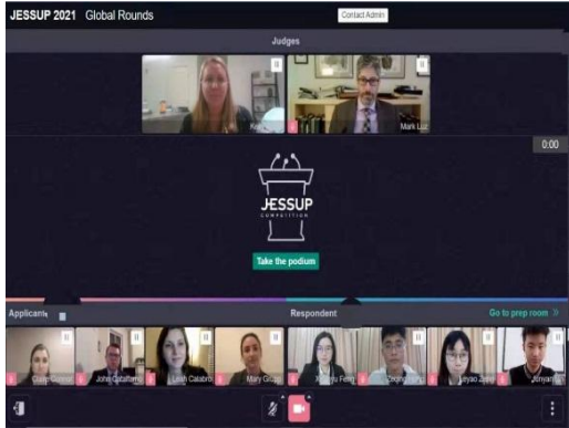
我院代表队对阵美国乔治华盛顿大学