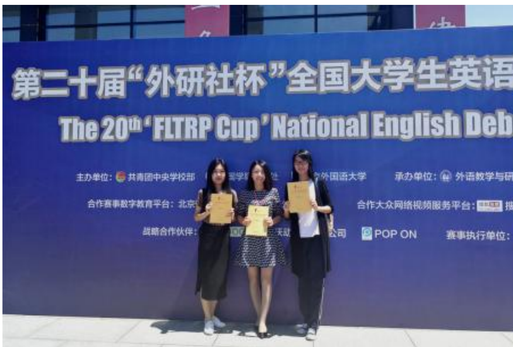
商英学院研究生获第二十届“外研社杯”全国大学生英语辩论赛一等奖

毕业生就业范围广泛，毕业生分布在跨国公司、大型国内企业、政府外事外经部门、外交部、商务部等单位，毕业生受到用人单位的一致好评。