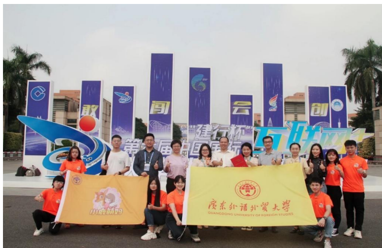
图 2: 2020 年我院“小鹿萌妈”创业团队荣获全国“互联网+”创新创业大赛全国金奖及“挑战杯”中国大学生创业计划竞赛金奖

2022 届毕业生共有 27 人，其中男生 4，女生 23 人。 毕业生的就业去向主要是在文化产业、媒体、政府管理部门、企事业单位，从事文化艺术管理、文化经营、文化市场运作、文化项目策划、文化经纪、贸易、咨询和国际文化交流与传播工作。