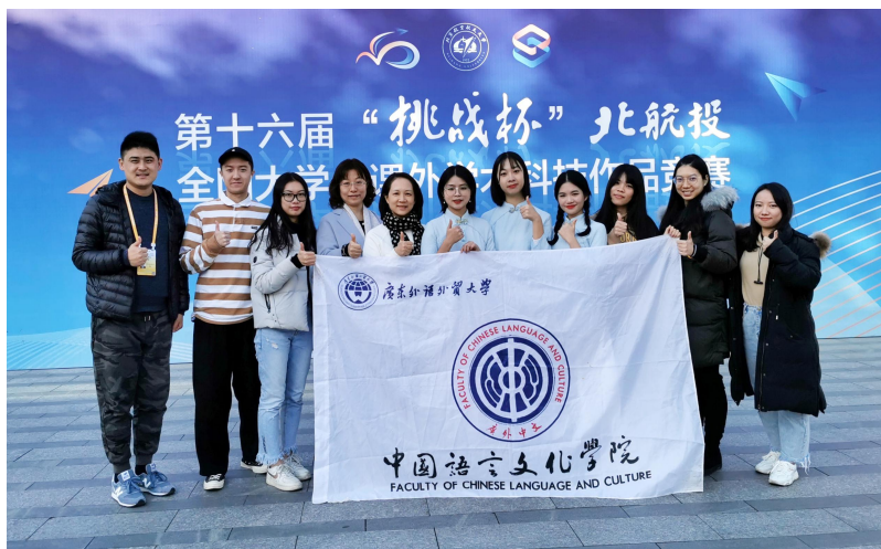
图 3: 我院学生在第十六届“挑战杯”全国大学生课外学术科技作品竞赛获二等奖