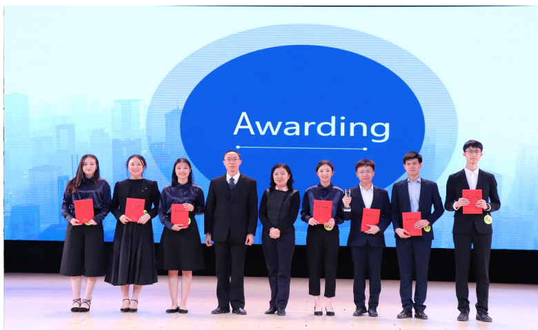
商英学院学子获全国商务英语实践大赛总冠军

2022 届毕业生共 417 人，其中男生 79 人，女生 338 人。 学院较早在所有专业推行全英教学模式，注重学生跨文化交际能力、实践能力、创新能力、就业创业能力和自主学习能力“五种能力”的培养，把知识传授与能力培养融为一体。毕业生主要去向为省市级国家机关、世界 500 强企业、四大国有银行、四大会计师事务所、外经贸单位、三资企业等，呈现“就业率高、就业层次高、就业满意度高、就业薪酬高”的四高态势。