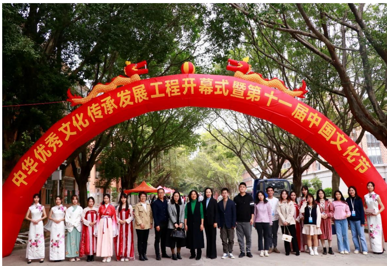
图 6: 中文学院第十一届中国文化节暨中华优秀传统文化传承发展工程开幕式