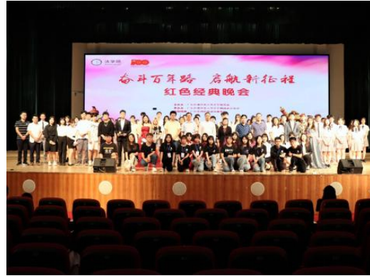
法学院 2021 年红色经典晚会