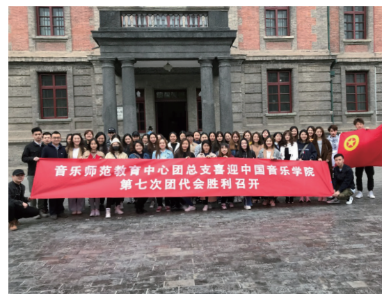
主题团日活动——赴新文化运动纪念馆参观学习