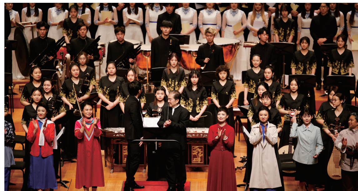
2021年声乐歌剧系音乐会版歌剧《江姐》

声乐歌剧系目前承担国家级重大课题1项,北京高校“优质本科课程”1门,拥有国家级教学名师1人,国家有突出贡献中青年专家1人,青年长江学者1人,全国优秀模范教师1人,中宣部“四个一批”人才4人,中宣部“五个一”工程奖1人,北京市高等学校教学名师4人,北京市高校研究生课程思政教学名师1人,北京市高校本科生课程思政教学名师1人,北京市高校优秀德育工作者1人。