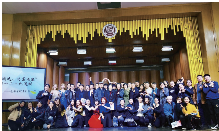
2019“心系国运、为国成器”纪念一二·九运动文艺汇演

基于中国音乐学院“中国乐派 8+1、思政 +X”课程体系建设，艺术管理系的本科生培养方案分为四大板块：专业课板块、学科基础课板块、专业基础课板块、通识课板块。并依据艺术管理专业特色将专业课分为两个课程群：艺术管理专业主课和专业实践课；专业基础课板块分为分为四个课程群：艺术管理基础课程群、艺术院团管理课程群、音乐商务管理课程群、辅修（技能）课程群。艺术管理系的硕士研究生课程分为：公共课程、专业必修理论类课程、专业必修实践类课程、开放性实践课程以及其他选修课程。