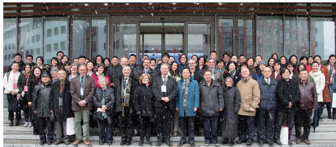
作曲技术理论专题交流季