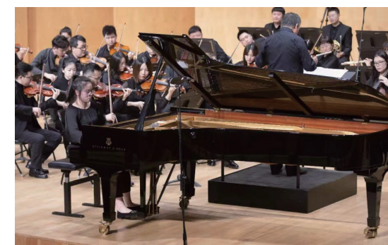
钢琴系协奏曲专场音乐会 -2