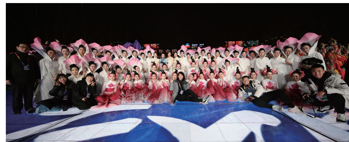
2019年中国北京世界园艺博览会

国乐系立足中国特色，融合多元文化的开放观念，形成了国乐系独特的办学传统，培养了几代杰出的中国音乐领军人才，引领和影响半个世纪中国国乐艺术教育的发展。