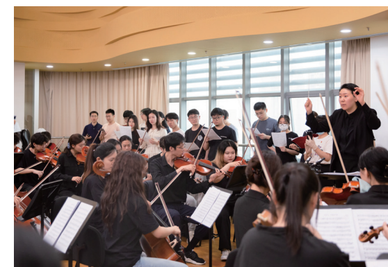
“走近乐队”主题活动暨配器实践课程思政公开课