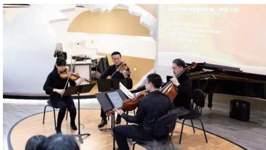
蛋壳空间午间音乐会 -1

管弦系紧紧围绕学校“承国学、扬国韵、育国器、强国音”办学理念,在教育教学、艺术实践中把握“中国音乐与西方乐器”的关系,探讨西方音乐作品与中国演奏者的情感表达相融会的规律,探索构建“用西方乐器诠释和传播中国文化”的人才培养模式,致力于在管弦音乐教育领域形成学科专业体系的中国印记、中国气派、中国风格和中国模式。