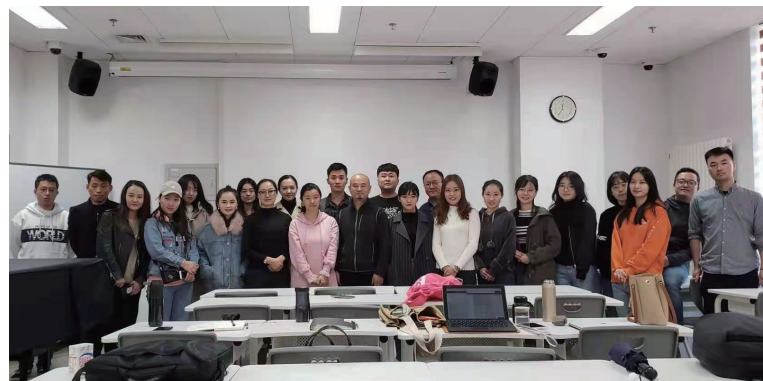
2019年艺术实践周班级合影