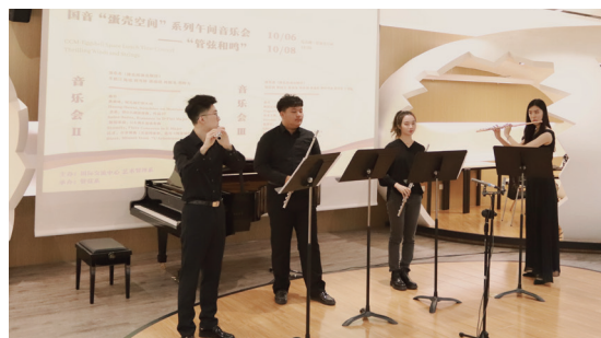
蛋壳空间午间音乐会 -2