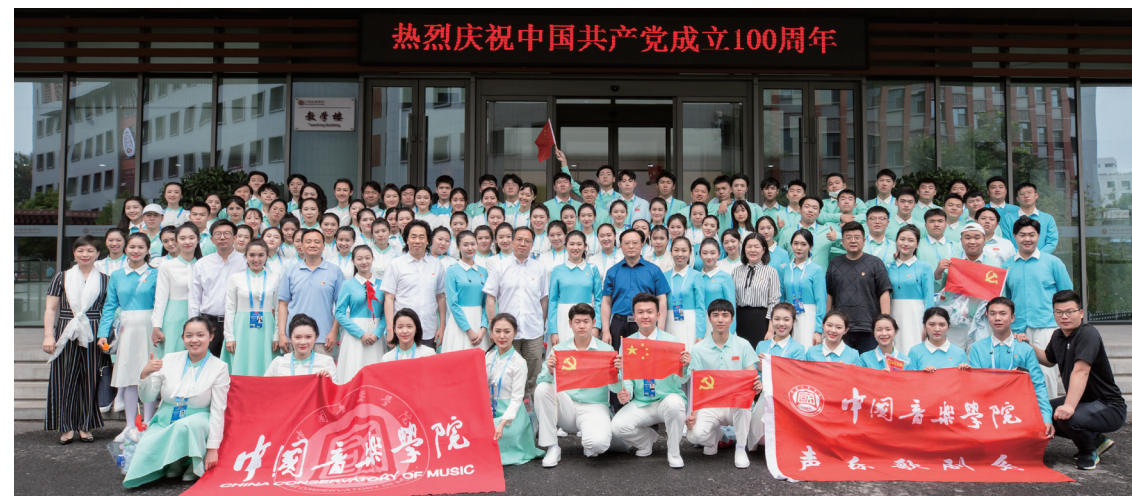
师生圆满完成庆祝中国共产党成立100周年大会合唱献词任务