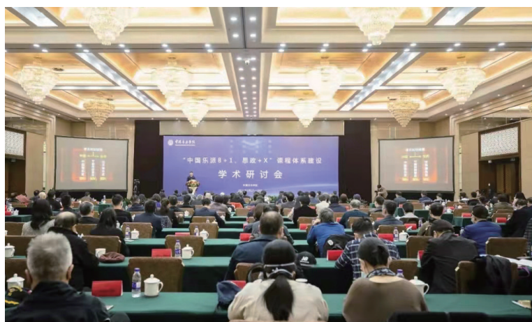
2021《“中国乐派 8+1、思政 +X”课程体系建设学术研讨会》