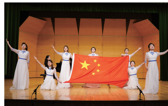
2021年中国歌剧教研室庆祝建党百年音乐会

中国声乐人才培养分为本硕博三层次,旨在培养德、智、体、美、劳全面发展,具备能够适应终身学习和生活发展需要的必备品格和关键能力,具有中华文化底蕴和全球文化视野、全面的音乐艺术修养、较好的文化理论水平和创新精神,热爱声乐表演艺术、掌握扎实的专业基础知识,拥有较高的音乐专业能力及国际交流能力,能够胜任在各大专业艺术院团从事演唱以及在专业艺术院、校、馆(宫)从事教学工作,能够适应我国社会、经济、文化和音乐事业发展需要的高层次、应用型音乐表演和音乐创作的高素质专门人才。