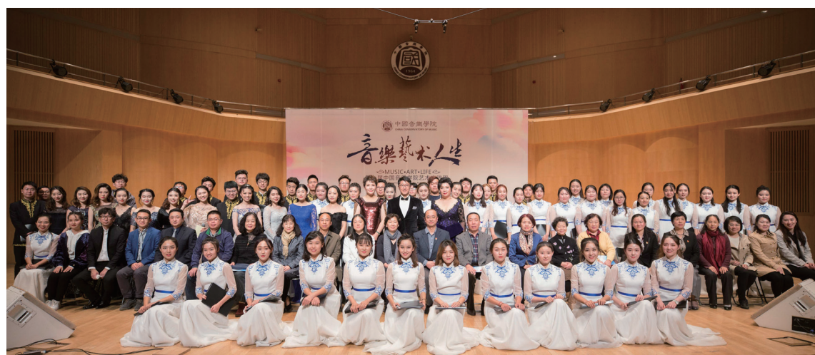
2020 教育学院艺术实践周专场音乐会

教育学院广泛开展国际交流活动,聘请美国、法国、英国、德国、意大利、俄罗斯、荷兰、澳大利亚、日本等国家及港澳台地区的专家教授来学院讲学,增强学生的国际交流意识,开拓学生的学术视野。