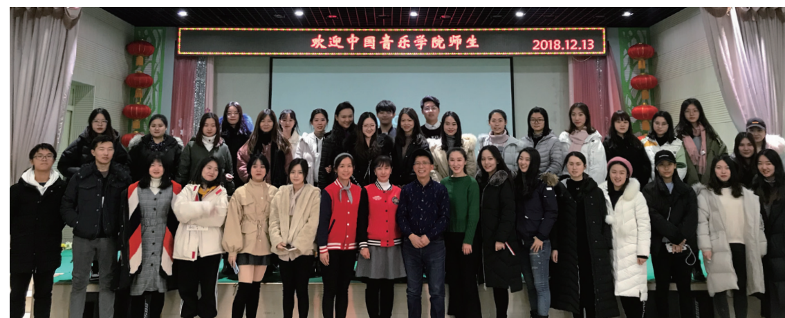
2018年教育学院师生赴合作学校开展教学观摩

教育学院教师承担众多国家、省部及校级科研项目,发表大量论著、论文等。教师和学生参加各级各类音乐比赛和学术评比所获得奖项数以百计。