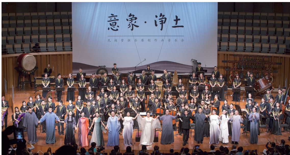
“意象·净土”民族管弦乐原创作品音乐会

中国乐器演奏是我们学校的重点学科之一,学习传统深入民间,在学习音乐母语的基础上掌握现代音乐的技能和发展理念,保持强势学科的领军地位。服务于社会,紧贴时代脉搏,在继承传统的基础上有所发展,为中国音乐走向世界做出应有的贡献。