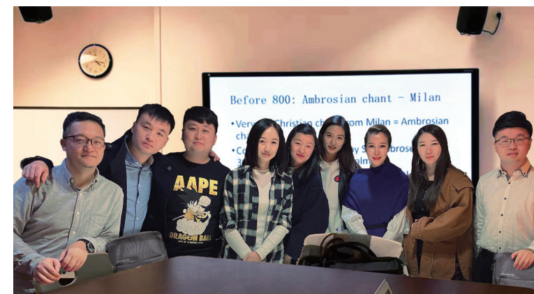
2019级博士班学术沙龙

音乐学系下设音乐史、民族音乐学与传统音乐、体系音乐学三个教研室,音乐史学教研室的专业方向主要是“中国古代音乐史、中国近现代音乐史、西方/世界音乐史”;民族音乐学教研室的专业方向主要是“中国传统音乐理论、民族音乐学、世界民族音乐”;体系音乐学教研室的专业方向主要是“数码音频技术、音乐传播、音乐美学”等。中国音乐学院音乐史学专业,经过近半个世纪的发展,目前已建成全国在中国音乐史学方面最具优势的学科队伍。在中外音乐史研究领域,从整体上形成一批特色多样、积累丰厚,在全国处于领先和前沿地位的学术研究成果。并以科研促教学,开设有多门高质量的各学科博士、硕士课程,并为全国各类院校培养了一批本专业的优秀人才。