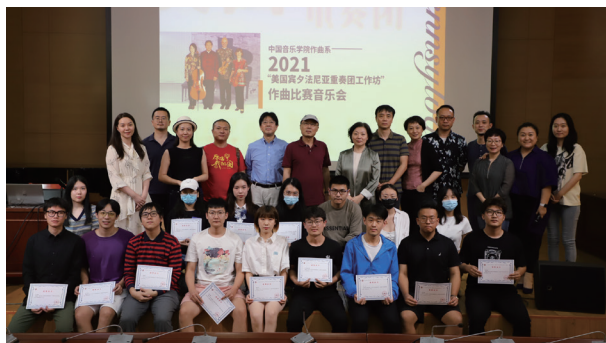
美国宾夕法尼亚重奏团工作坊作曲比赛音乐会

作曲与作曲技术理论专业是国家级一流专业。作曲系坚持党的领导,秉承中国音乐学院“承国学、扬国韵、育国器、强国音”的办学理念,准确把握学校“中国乐派 8+1、思政 +X”课程体系建设内涵,认真落实相关建设任务。作曲系积极建设一流学科,努力打造国内音乐专业院校品牌“金课”,探索中国音乐教育体系之作曲教学体系的构建和“中国乐派”之作曲创作体系建设层面的传承与发展之路,拓展创作方向,在音乐创作、理论研究和教材建设等方面取得了突破性进展,为培养具有扎实作曲理论基础、深厚人文素养与广袤国际视野的复合型音乐创作人才奠定基础。在学生在校期间通过各类赛事展示自己的专业能力,施展自己的才华,并在国内外各类专业比赛中获奖,如“金钟奖”、“文华奖”、“中国之声”作曲比赛、“新生代”作曲比赛等。