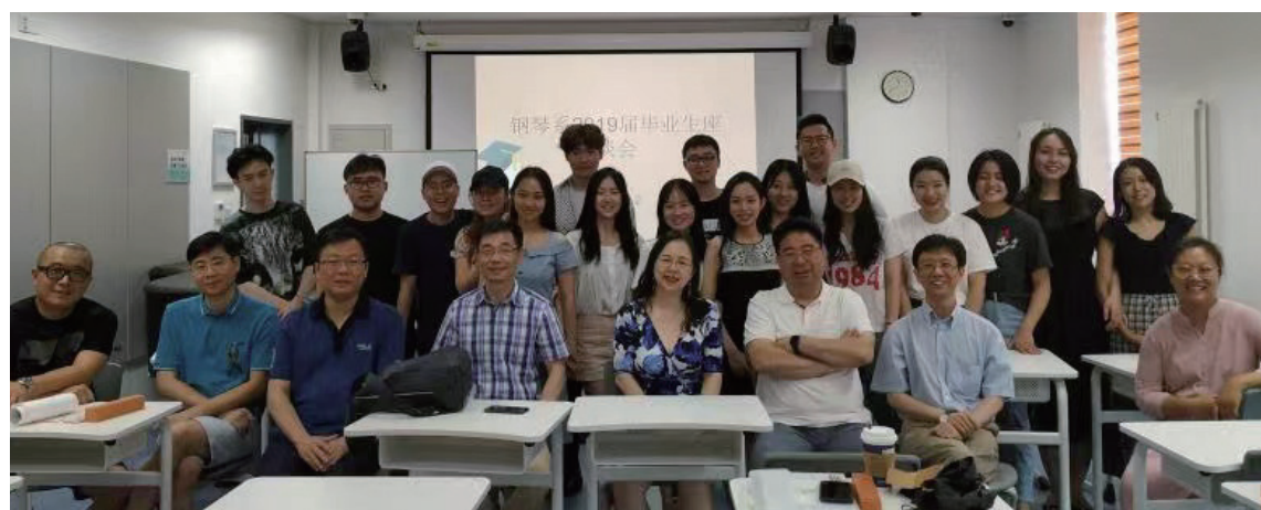
钢琴系毕业生座谈会

钢琴系立足教学, 全面开展国际交流活动, 聘请国际上极具威望的专家教授来校讲学, 促进国际交流, 拓宽学术视野。重视党建和学生工作, 以党建促教学和发展, 为国家和社会培养了一大批教学、表演、研究、管理的优秀人才。