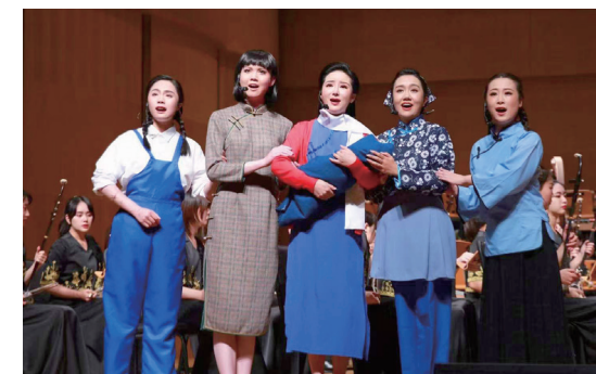
2021年声乐歌剧系音乐会版歌剧《江姐》