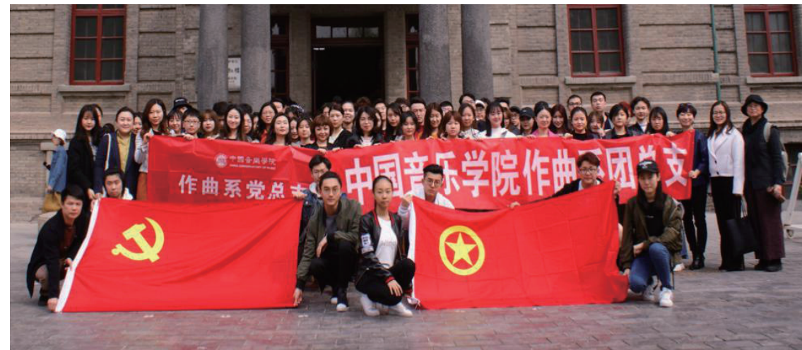
主题党日——参观北大红楼