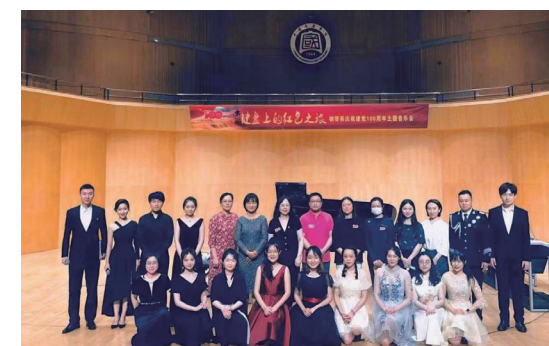
键盘上红色之旅音乐会