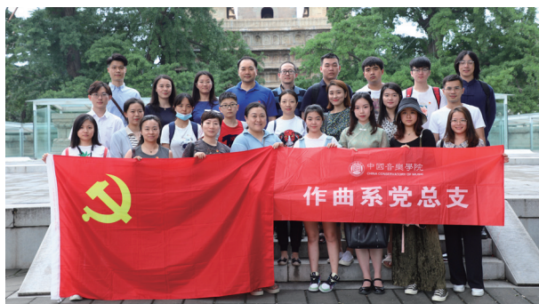
主题党日活动——参观北京石刻艺术博物馆活动