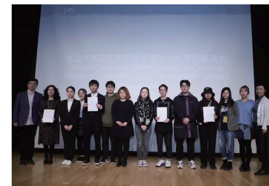
2019 全国大学生艺术项目创意策划大赛