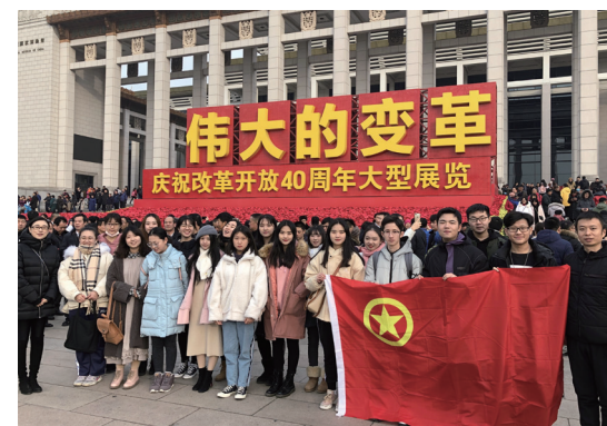
2018 级本科生参观“伟大变革” 庆祝改革开放 40 周年大型展览

2022 届毕业生曾荣获国家奖学金、国家励志奖学金、全国大学生艺术项目创意策划大赛、中国国际“互联网 +”大学生创新创业大赛等多项国家级荣誉奖项。作为新一代的艺术管理者、艺术经纪人、策划人、节目制作人等,他们在文化事业和文化产业部门,如各级政府文化艺术管理部门、各类艺术院校教育管理部门、各类表演艺术团体、影视业、演出公司、群艺馆等部门从事管理工作。