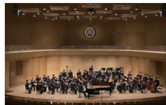
钢琴系协奏曲专场音乐会 -1

以立德树人为根本任务, 培养具有社会主义核心价值观和坚定理想信念, 全面发展的优秀钢琴演奏与教学人才。因材施教, 帮助学生确定专业发展方向, 根据学生自身特点, 为学生量身打造教学计划, 最大限度地挖掘学生的潜能和天赋。同时, 要求学生通过系统的学习, 了解各个时期不同作曲家作品的演奏要求与音乐风格, 掌握丰富的中外钢琴文献与经典作品; 培养传播中国价值, 展示中华文化魅力的音乐使者, 力争在国内外重大比赛中获得优异成绩。