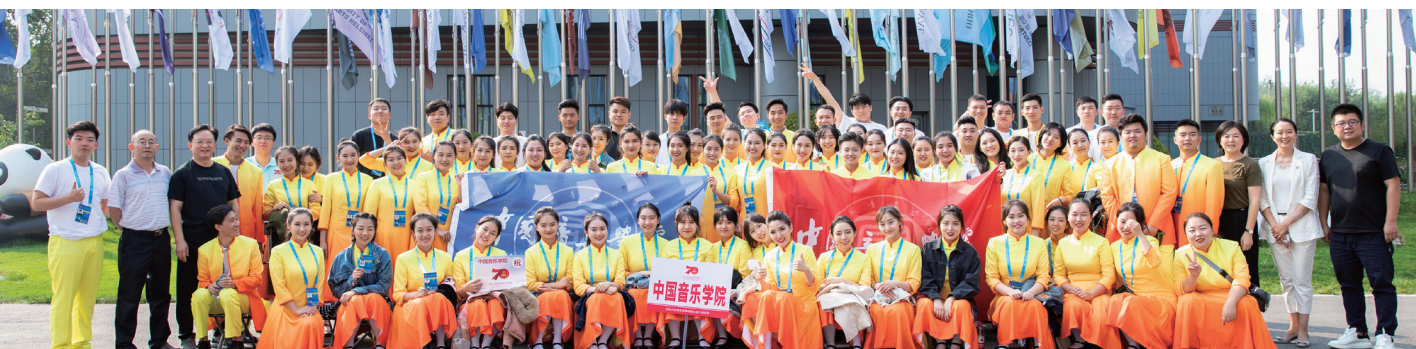
2019年声乐歌剧系师生圆满完成国庆70周年合唱任务

声乐歌剧系秉承“继承传统、借鉴西方”的专业建设基本原则,在“承国学、扬国韵、育国器、强国音”的办学理念下,探索声乐表演艺术从“民歌传唱”到“民族声乐”,再到“中国声乐”的学科建设发展路径,贯彻“书本教材与活教材并重”,注重课程建设,努力建构符合声乐表演教育规律的课程体系,研制与本专业学生的素养、知识、能力结构和培养规格相适应的培养方案。目前,已形成以本科生为主体,研究生、博士生教育为重点的多层次办学体制。声乐歌剧系重视课程建设,逐渐形成了以专业主课为核心,特色风格课程为支撑的课程体系,除声乐专业主课,还包括钢琴、台词、表演、形体、曲艺、豫剧、昆曲、京剧、意大利语、德语、法语等。其中“中国民族声乐教学”课程被评为北京市级精品课程。