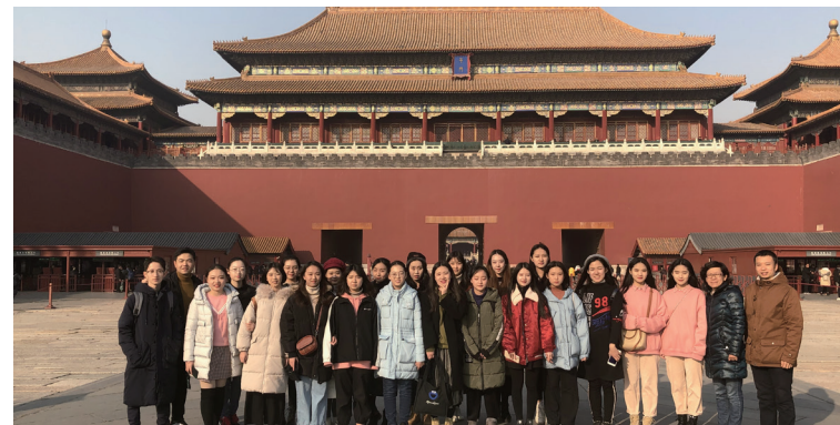
2018级本科生开展“走进故宫 传承文化”主题团日活动

中国音乐学院艺术管理系于2002年正式成立,于2003年开始招收本科生,于2007年开始招收硕士研究生。艺术管理系本科专业为艺术管理,硕士研究生招生方向为音乐艺术管理,并设有专业硕士剧院管理方向。专业设置旨在培养学生具有中华文化底蕴和全球文化视野,能够对接国家文化事业发展与公共文化服务体系建设,掌握表演艺术组织运营规律的艺术行政管理优秀专门人才,能够对接国家文化产业发展尤其是音乐产业发展,掌握商业运行规律的音乐制作人、音乐经纪人等音乐商务管理高素质创新人才。