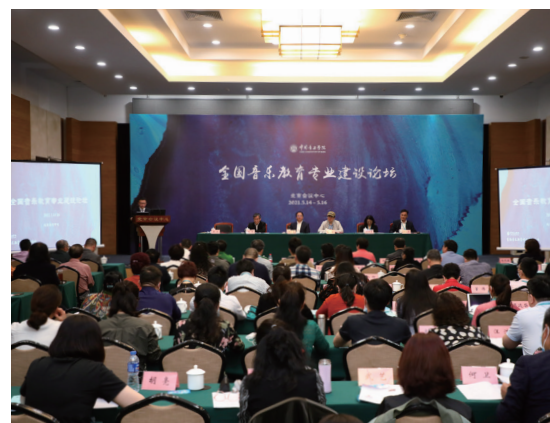
全国音乐教育专业建设论坛

教育学院始终以学校“承国学、扬国韵、育国器、强国音”的办学理念为指导,凝心聚力,不断进取,以音乐教育本科专业成功申报为契机,加强对新设专业的建设,不断提高人才培养质量,以学科建设带动学院整体发展,秉承培养“独秀艺术之巅,绽放百姓人家”的未来音乐传承者的教育理念,努力建设成为“全国一流,具有国际影响力”的音乐教育高端平台与基地,为中国音乐学院“双一流”与高水平研究型大学建设贡献力量。