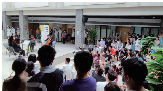
蛋壳空间午间音乐会 -4