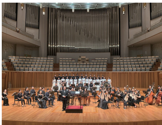
2020 教育学院学生参演国家大剧院 民乐歌剧专场音乐会

教育学院学生毕业时要求掌握,“中国乐派 8+1 课程版块”中的课程内容和“思政 +X 课程版块”中的课程内容(“中国乐派 8+1 课程版块”包括专业课、专业基础课 1、专业基础课 2,“思政 +X 课程版块”包括国家规定思想政治类课程 + 人文通识类课程、英语、政治)以及第二课堂修读。本科生毕业时还需完成教育实践活动(包括教育实习一学期、说课 15 分钟)、毕业论文、技能毕业汇报;研究生毕业时需完成毕业论文、个人音乐会(仅声乐教育研究方向、钢琴教育研究方向学生)。