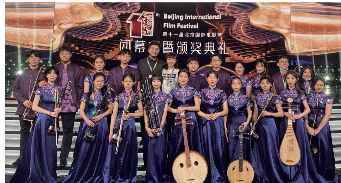
第 11 届北京国际电影节闭幕暨颁奖典礼