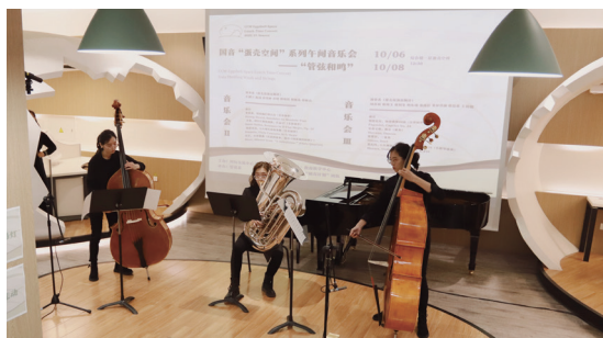
蛋壳空间午间音乐会 -3